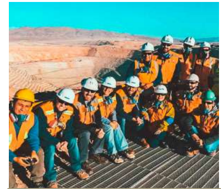
Visitas a Faenas