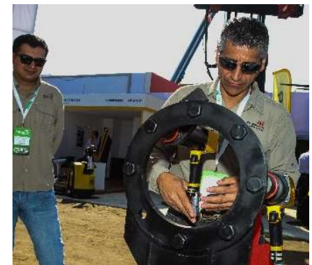
Zoom de Innovación