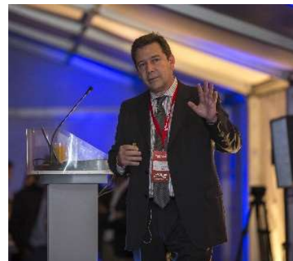
Networking After Office