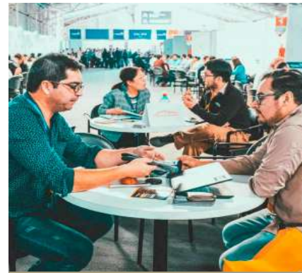
Reuniones de Negocios